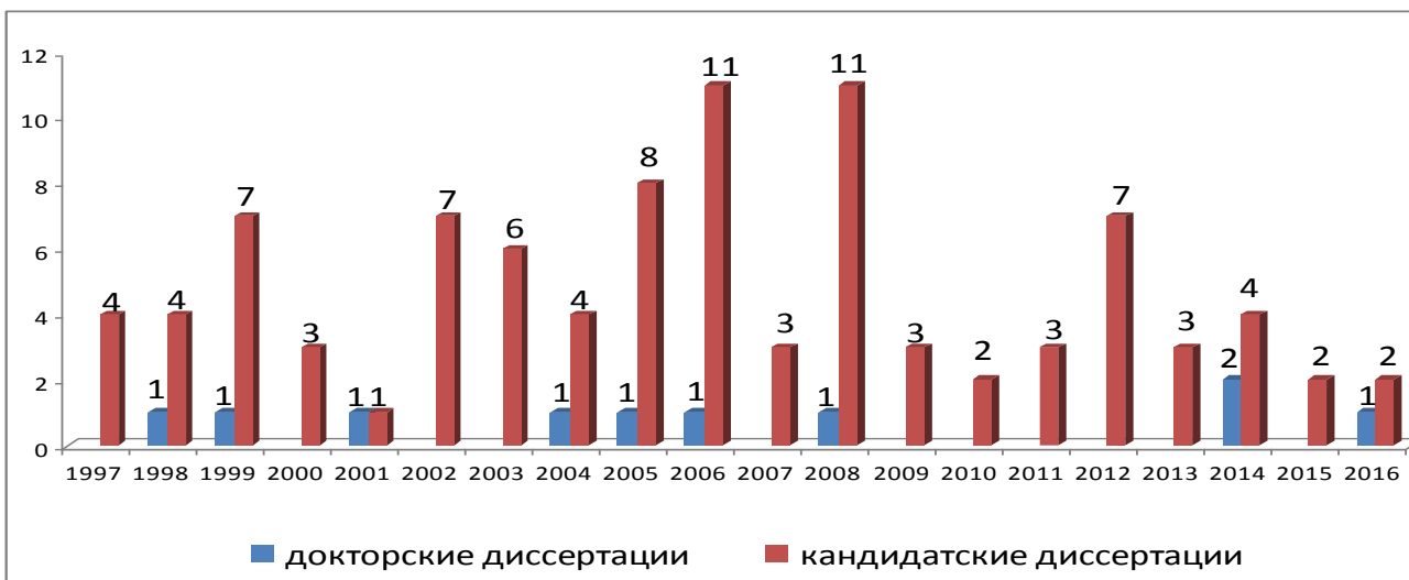
Таблица 4 Динамика защит кандидатских диссертаций преподавателями, сотрудниками и аспирантами НУА

Остальные кафедры все еще недостаточно включены в эту работу, набор в аспирантуру ведется фрагментарно, инициатива кафедр практически отсутствует. Не менее важно – сохранение контингента путем системной работы научных руководителей с аспирантами, усиления требовательности к результатам их деятельности.